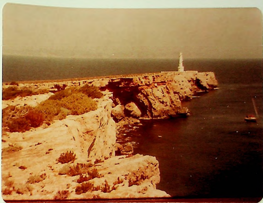
Cantil del N. y Faro de la isla de Espardell. Este candil es ocupado por las Pardelas, principalmente la pichoneta Puffinus puffinus mauretanicus , y el Paiño, Hydrobates pelagicus , como zona de reproducción