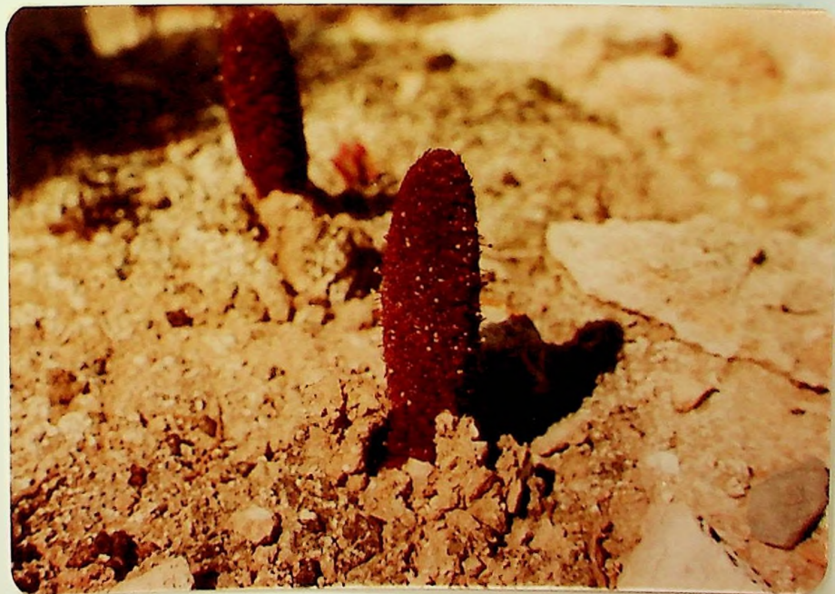
Cinomerium coccineum , planta mediterránea, parásita en saladales, muy localizada. Falta en Mallorca y Menorca, pero abunda en Formentera en el Estany Pudent y cantiles de la Mola y en Espardell, donde está obtenida la fotografía.