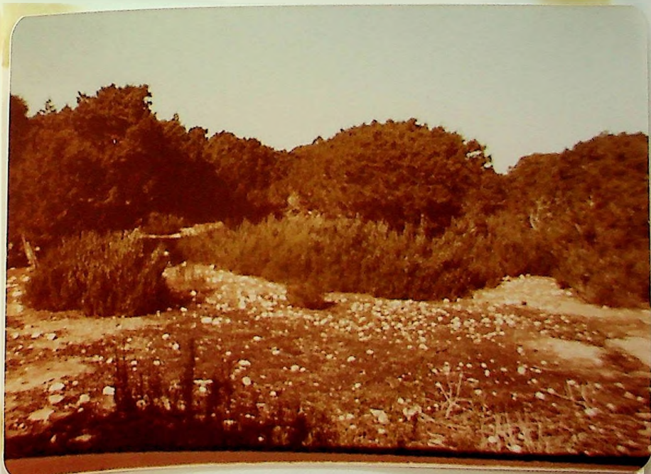
Sabinar sobre romero en el interior de la isla del Es- palmador.