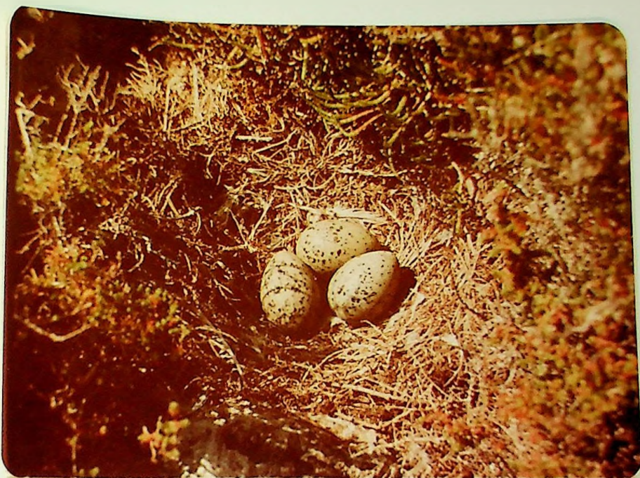
Nido de gaviota Argentea, Larus argentatus muchaelensis , especie muy abundante en el litoral, con cuatro colonias de reproducción en Formentera. Fotografía obtenida en Espardell.