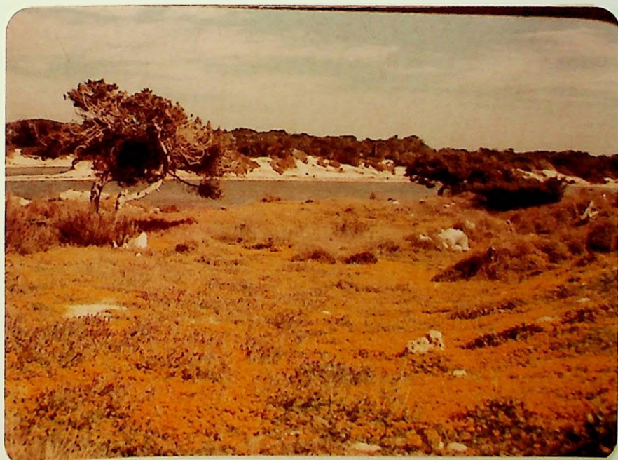
Tomillar con sabinas, fotografiado cerca de San Francisco Javier en la isla de Formentera. El sabinar es muy disperso.