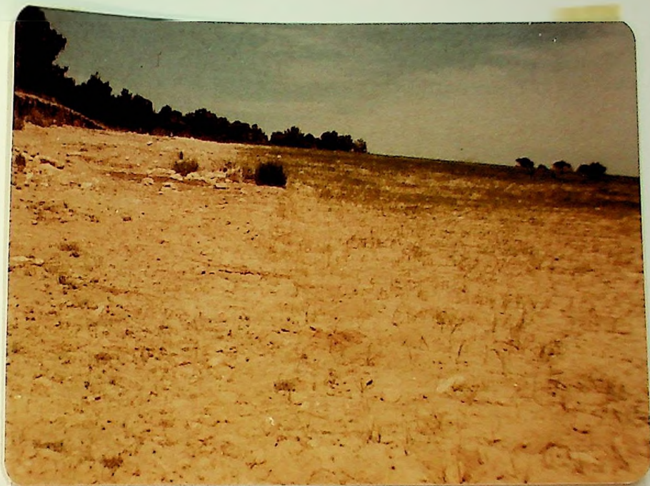
Dunas con Ammophiletum al S.E. de la isla. Probablemente la cobertura dunal mejor conservada de Baleares. Fotografía tomada en la isla de Espalmador